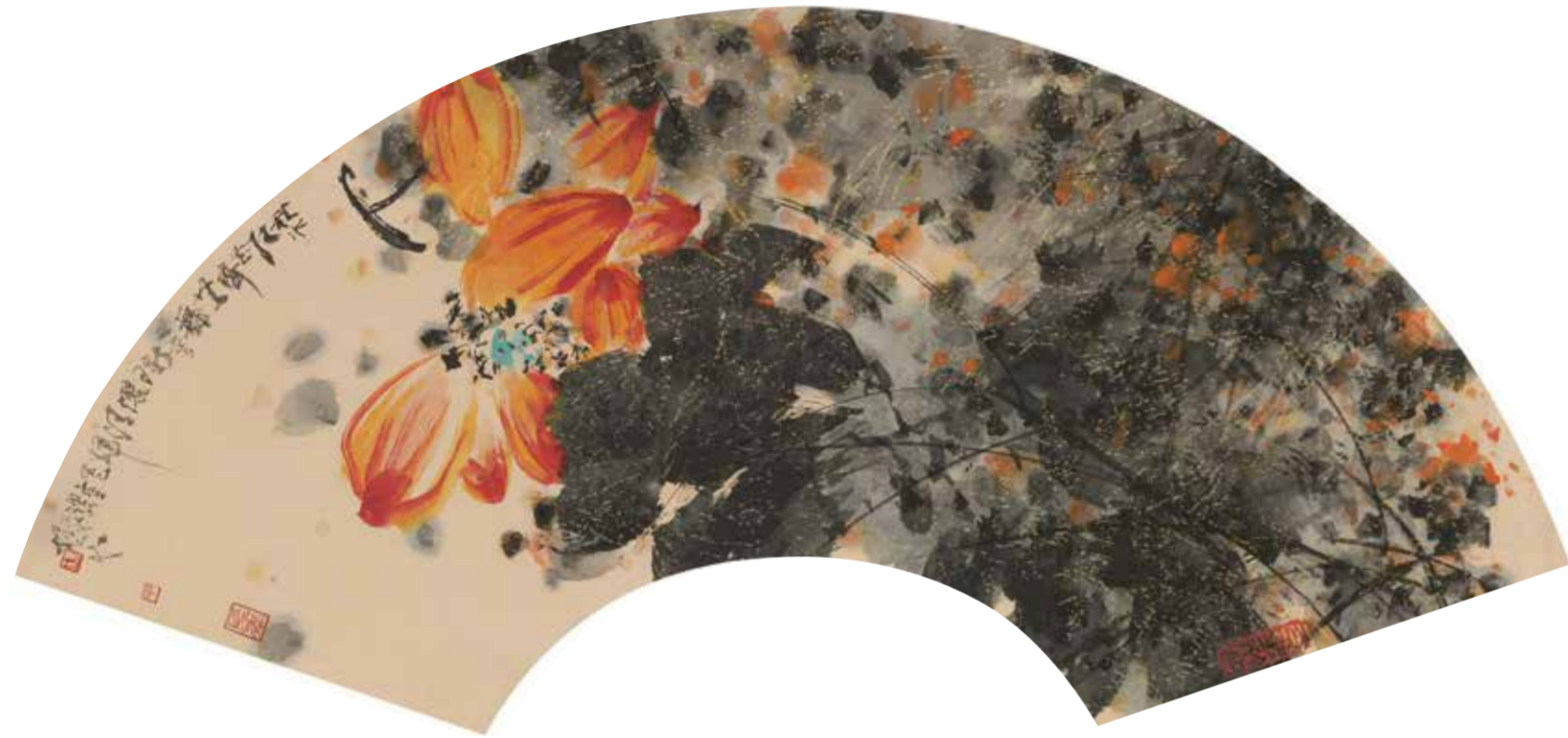
秋水紅花 2013年 29cm×63cm