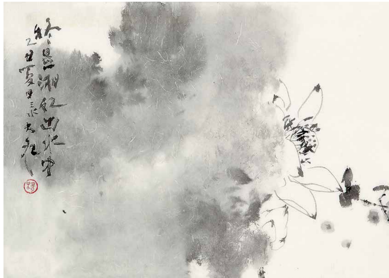
疑是香妃出水中 2009年 37cm×52.6cm