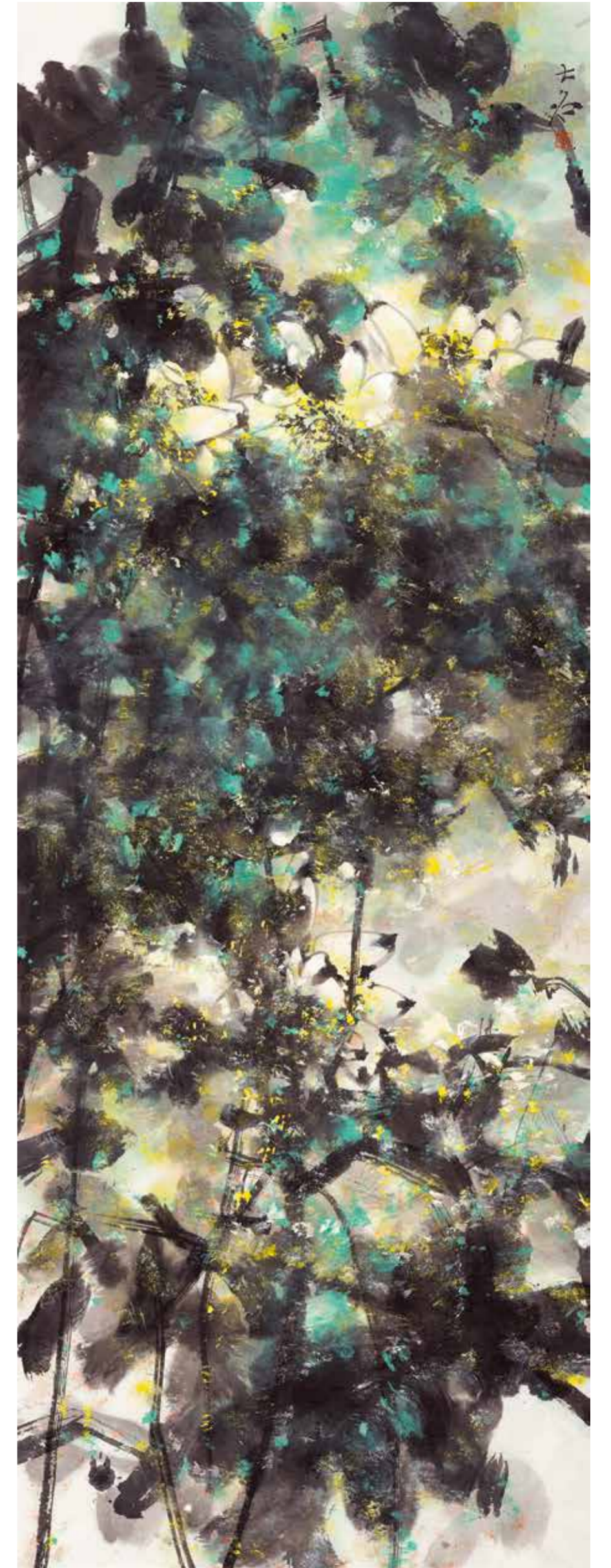
翠雲 2015年 188cm×68cm