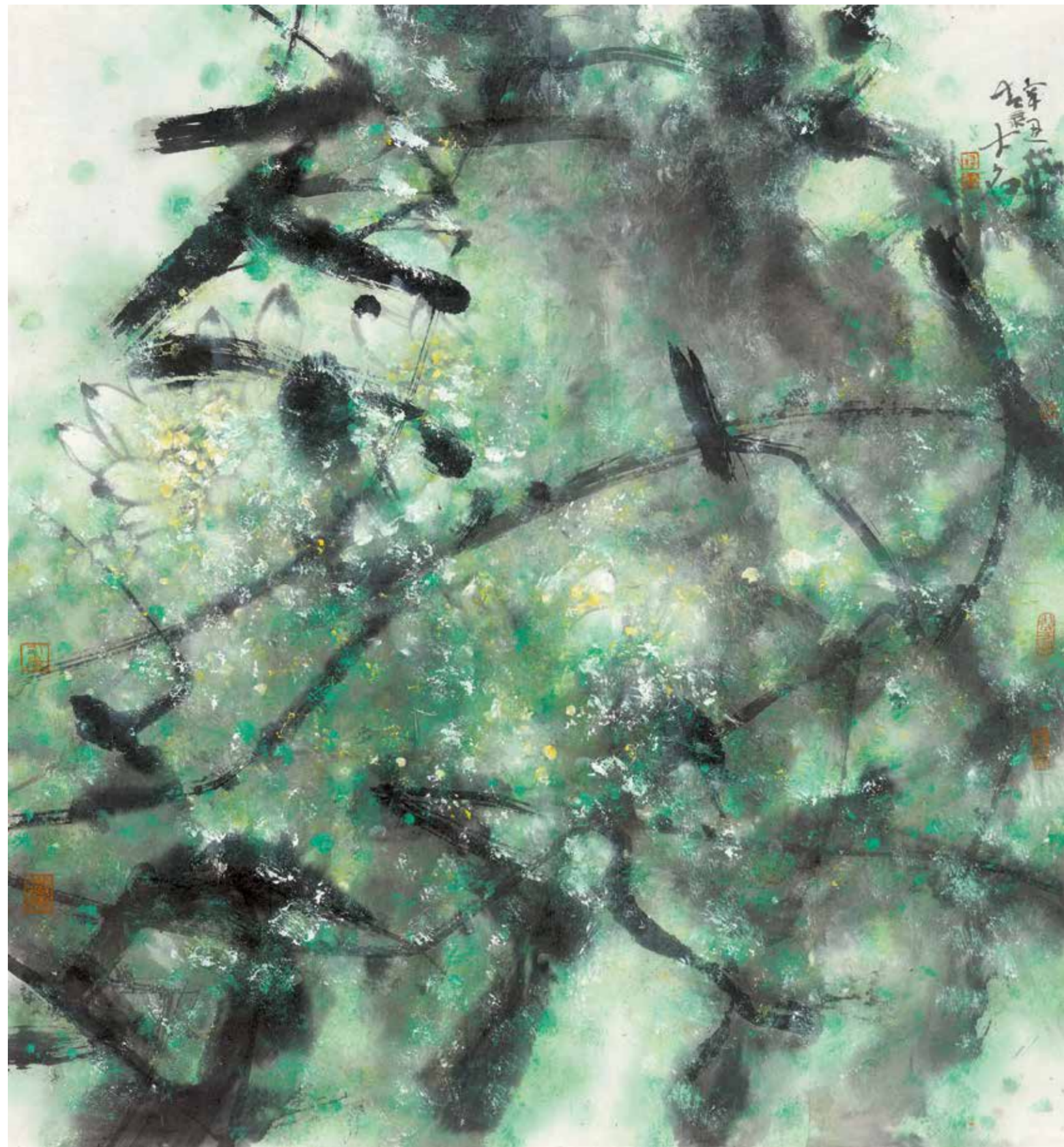
涼風習習 2022年 96cm×89cm