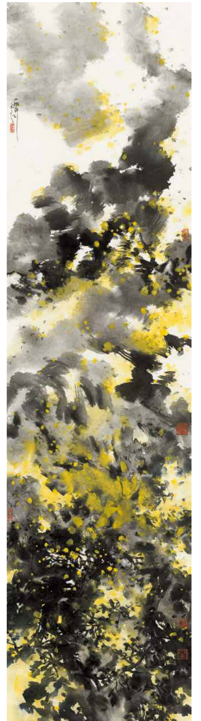
華山秋色 2016年 243cm×60cm