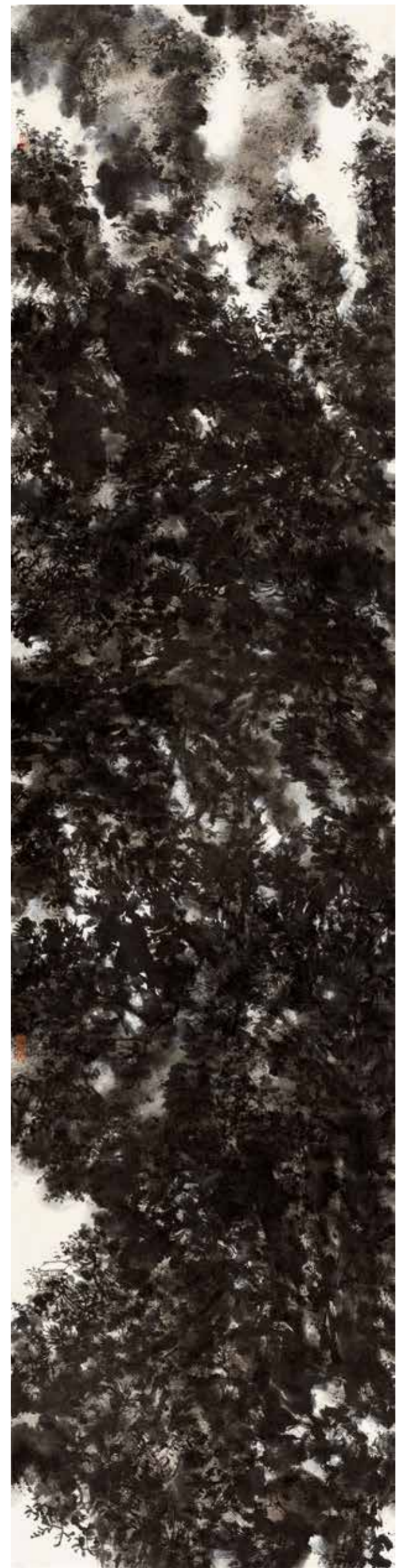
群峰幻出奇 2016年 240cm×59cm