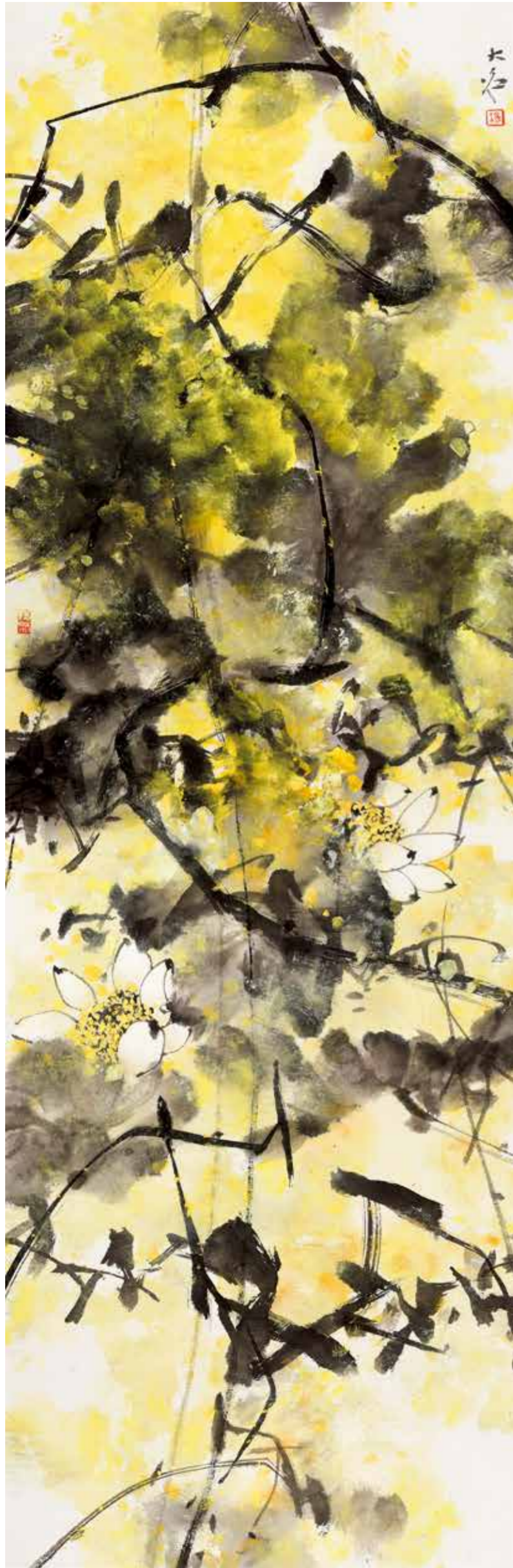
《蓮花獻瑞》組畫之三 2019年 196cm×64cm 榮獲法國美術家協會主辦的159屆巴黎國際藝術展頒發的國際美術金獎