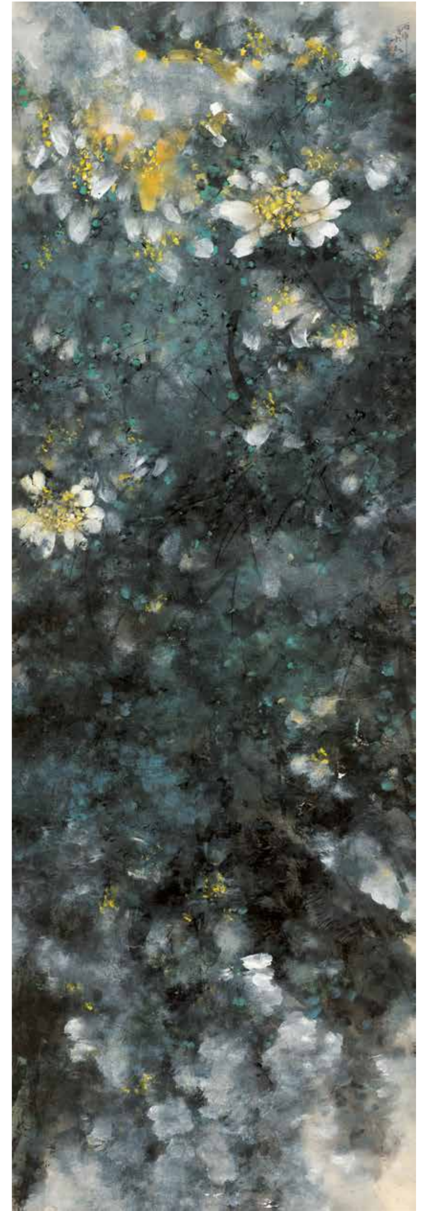
《蓮花獻瑞》組畫之七 2019年 196cm×64cm