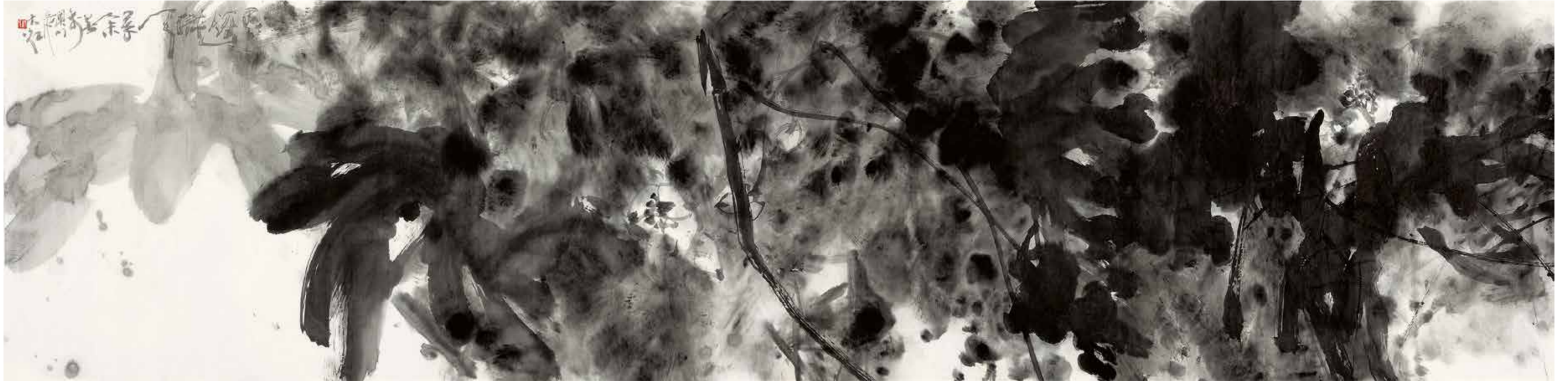
天章 2015年 60cm×236cm